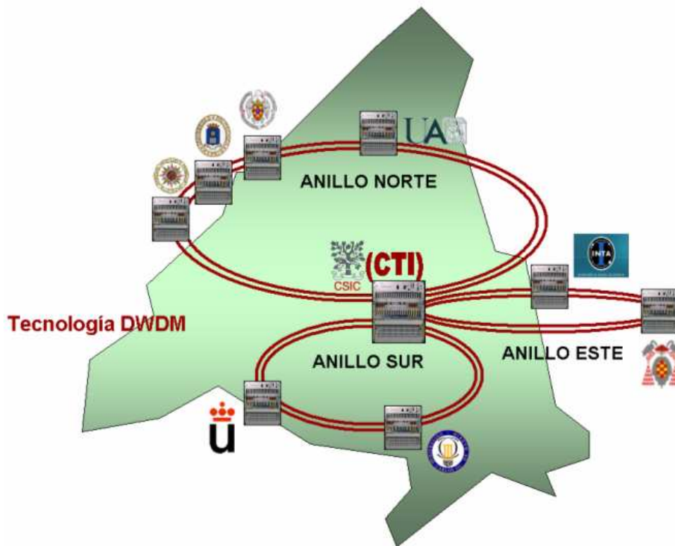
Figura 1. Topología física de la Red Telemática de Investigación de Madrid